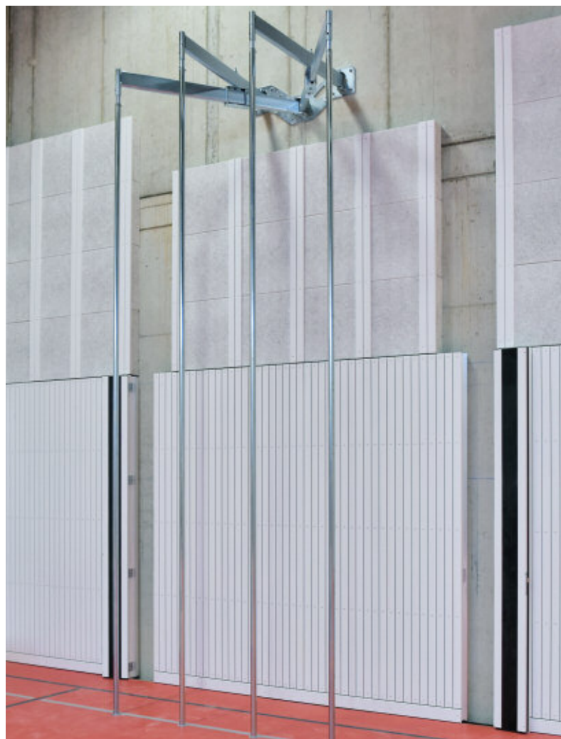
K4 Prallwand links geöffnet, rechts komplett geschlossen