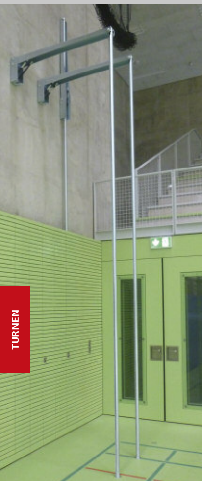
K1 mit 2 ausgeklappten Kletterstangen