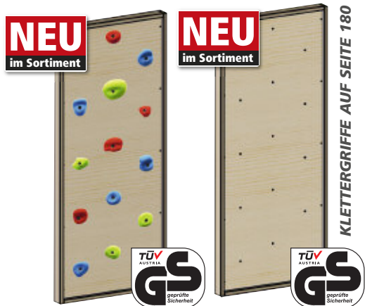
Junior Kletterwand mit Griffen 3038 | Junior Kletterwand ohne Griffen 3093