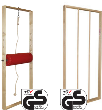
Junior Klettertau-Reck 3078 | Junior Kletterstangen 3039