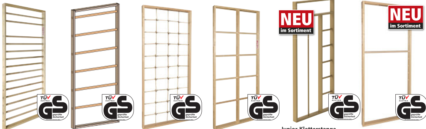
Junior Sprossenwand I 3041 | Junior Sprossenwand III 428,90 3087 | Junior Kletternetz 3047 | Junior Gitterleiter 3063 | Junior Kletterstange und Leiter 3046 | Junior Reck 3095