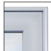
Einfacher Austausch der Glasscheiben durch Klick-System