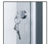
Schloss in rostfreier, stabiler Ausführung