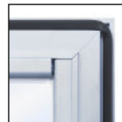
Dichtungen verhindern das Eindringen von Wasser und Staub