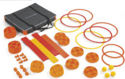
Entspricht der Norm NFS 54-300 Sicherheit bei motorischen Übungen