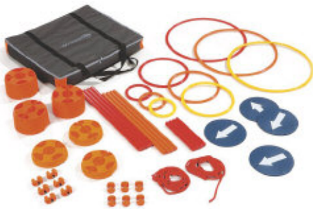
Entspricht der Norm NFS 54-300 Sicherheit bei motorischen Übungen