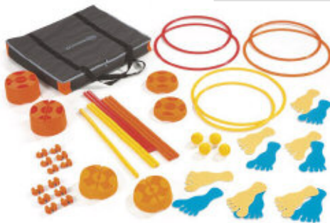
Entspricht der Norm NFS 54-300 Sicherheit bei motorischen Übungen